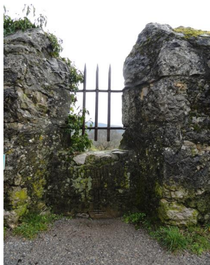
Škocjanske jame: razgledišče nad Okroglico