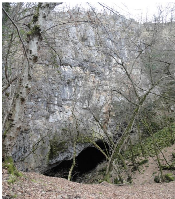
Udornica Bukovnik pri Divači