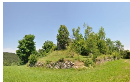
Razvaline gradu in rekonstrukcija nekoč mogočnega gradu Švarcenek nad Podgradom