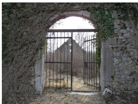
Razvaline gradu Školj