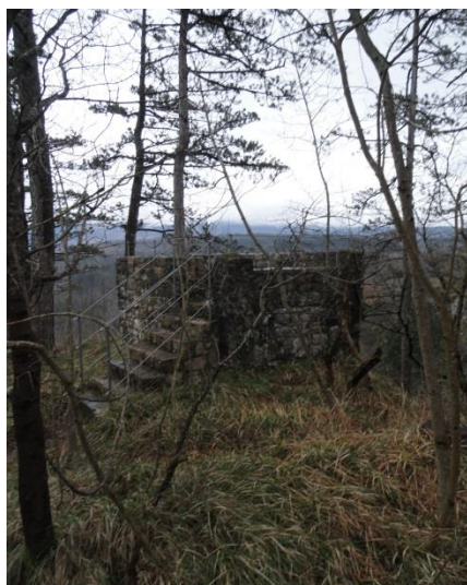
Škocjanske jame: razgledišče v Bošketu