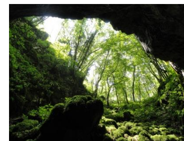
Staroverski spodmol Triglavca pri Divači