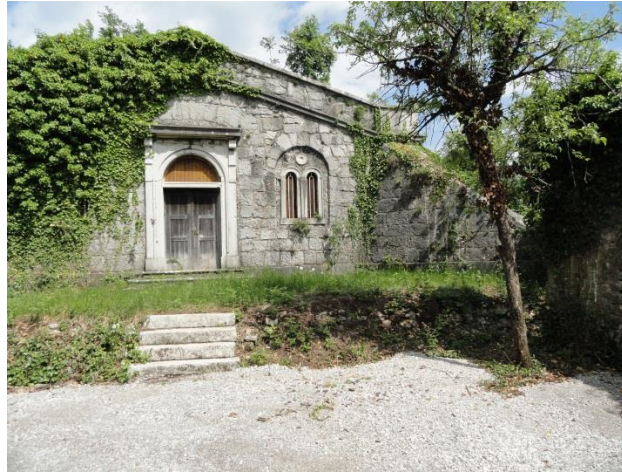
Pokriti rezervoar Južne železnice v Divači