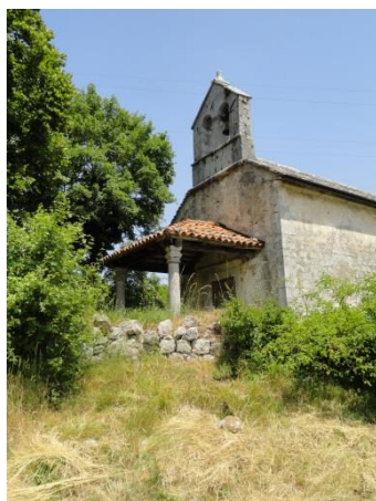
Cerkev Sv. Helene na Gradišču pri Divači in detajl fresk iz 15. st.