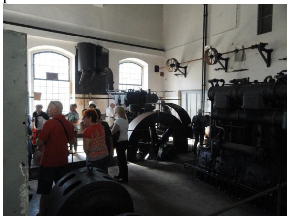
Črpališče Vodarne Draga v Vremški dolini