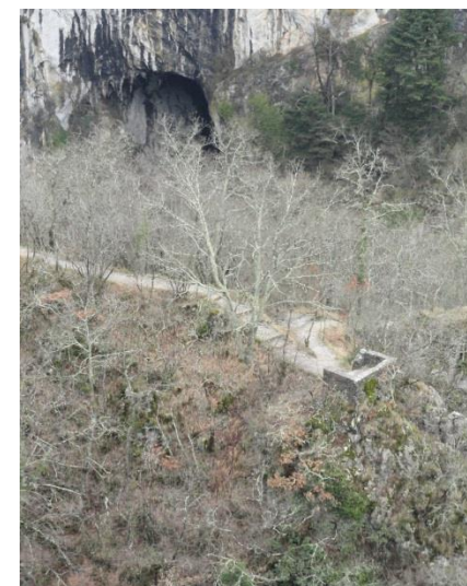
Škocjanske jame : Mariničev razglednik