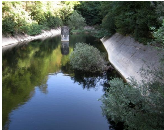
Vodno zajetje Južne železnice Zahodni Tajh pod Vremščico