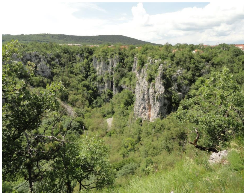
Udornica Risnik pri Divači