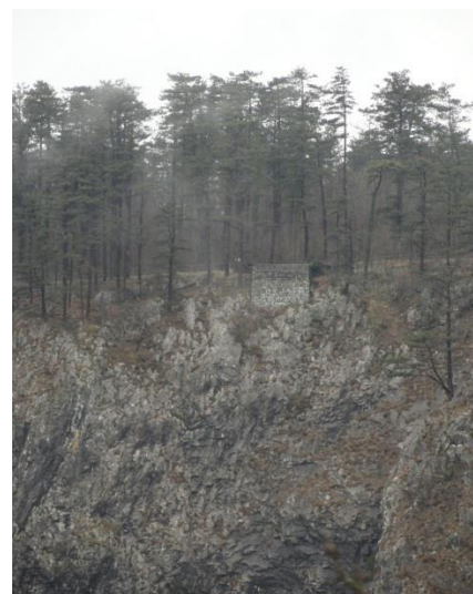
Škocjanske jame: Štefanjino razgledišče