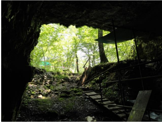
Arheološka izkopavanja v spodmolu Mala Triglavca pri Divači