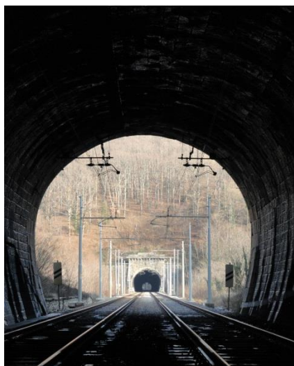
Tuneli Južne železnice pod Vremščico