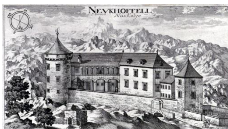
Grad Školj na Valvazorjevi grafiki