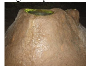
Nenavadni lom svetlobe v jezercu na prirezanem kapniku