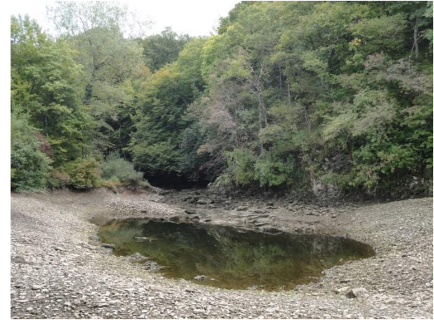
Sprehod po suhi strugi reke Reke pri Gornjih Vremah

Seznam obiska znamenitosti se določi za vsako skupino gostov posebej glede na želje, razpoložljivi čas, prevozna sredstva (osebni avtomobili ali avtobus) in sposobnost hoje. Cena vodenja znaša za 4 ure 100 eur, za 6 ur 150 eur, za 8 ur pa 200 eur.