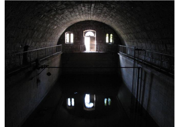
Notranjost pokritega rezervoarja v Divači