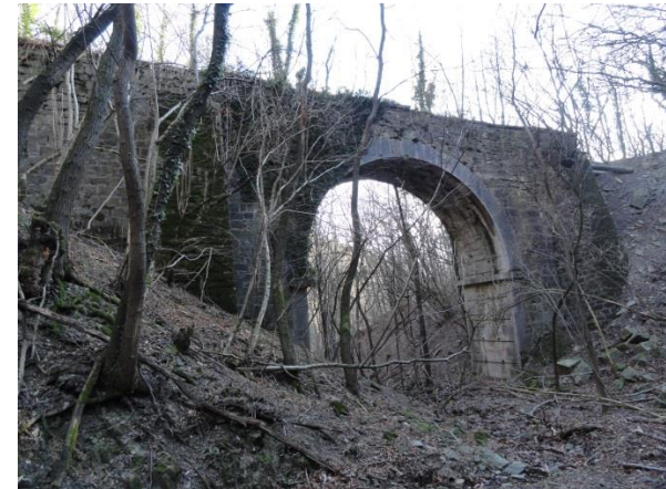
Akvedukt pod zajetji Tajhi