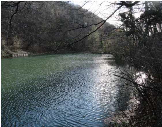
Vodno zajetje Južne železnice Vzhodni Tajh pod Vremščico