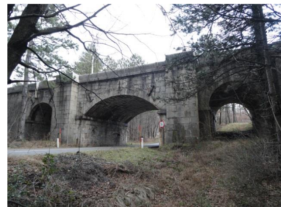
Kamniti mostovi Južne železnice